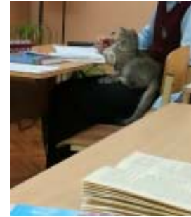
Котов и тех обучает Физтех!